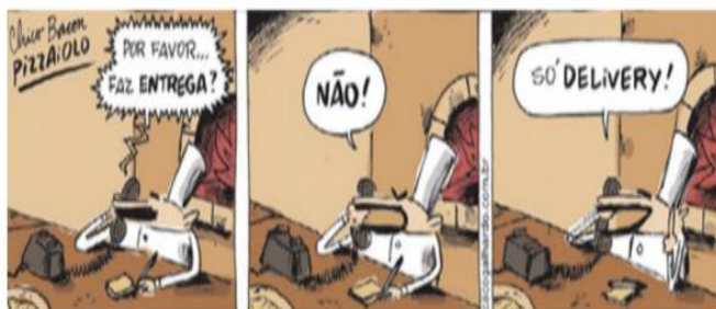
(GALHARDO, Caco. Chico Bento Pizzaiolo. Blog do Galhardo)

11- Sobre a tirinha assinale a alternativa correta: