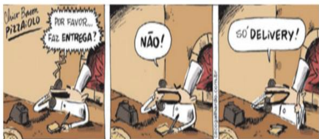
(GALHARDO, Caco. Chico Bento Pizzaiolo. Blog do Galhardo)

11- Sobre a tirinha assinale a alternativa correta: