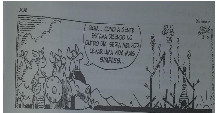
(BROWNE, Dik. O melhor de Hagar, o horrível 8. Porto Alegre L & PM, 2018 p. 70)

12- A expressão dos personagens da tirinha pode ser definida pelo sentimento de: