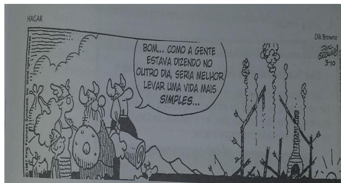
(BROWNE, Dik. O melhor de Hagar, o horrível 8. Porto Alegre L & PM, 2018 p. 70)

12- A expressão dos personagens da tirinha pode ser definida pelo sentimento de: