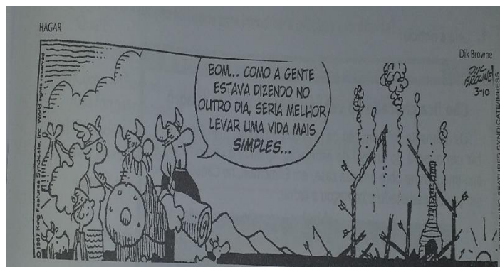
(BROWNE, Dik. O melhor de Hagar, o horrível 8. Porto Alegre L & PM, 2018 p. 70)

12- A expressão dos personagens da tirinha pode ser definida pelo sentimento de: