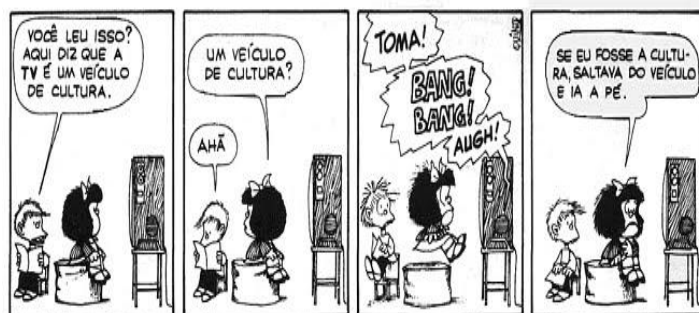
Quino, Mafalda 2. São Paulo: Martins Fontes, 2002.

6- Qual a alternativa correta acerca do humor no texto?